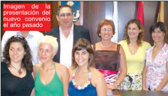
Imagen de la presentación del nuevo convenio el año pasado

El PP de La Vila inicia la desaparición del servicio de la Enfermera escolar en los colegios vileros, al no apoyar la petición para que Educación autorice a los profesionales a estar en los centros educativos.