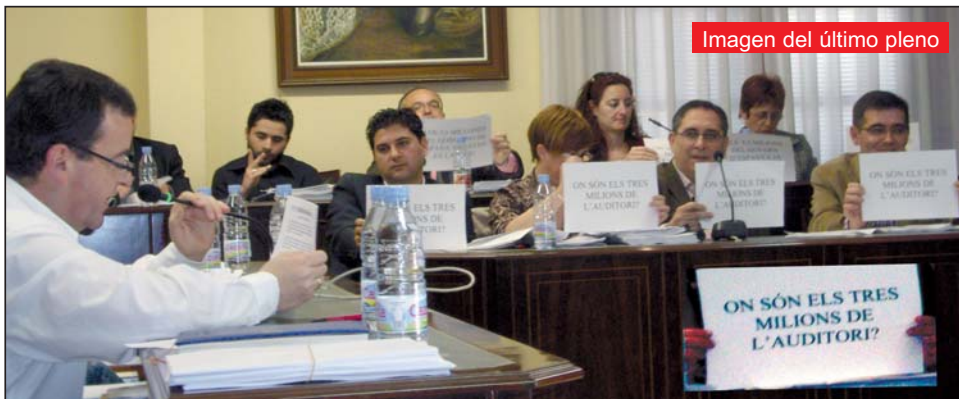
Imagen del último pleno

El PP calcula que recaudará un 135% más que el anterior gobierno en multas de tráfico.